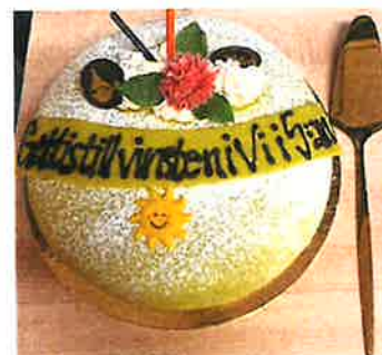
Uppmuntra barn och ungdomar