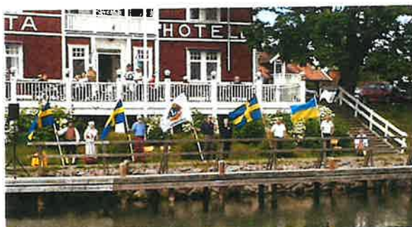
Kultur och traditioner