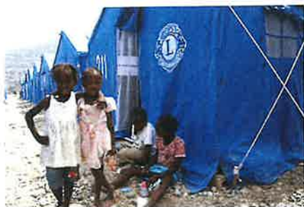
Vi hjälper människor i nöd